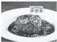
グランプリに輝いた飛騨牛揚げおにぎりチーズカレー

2019年初出場した時の反省を踏まえて、味も接客もグレードアップして臨んだ5年ぶりの大会で2位以下を大きく引き離し全国の頂点にたちました。優勝の喜びを報告のために豊橋市長を表敬訪問し「今後も頑張ってください」とエールを送られました。