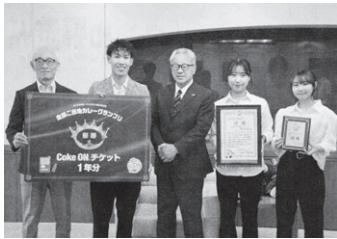
5月31日東愛知新聞より