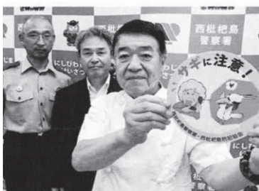
8月3日中日新聞より

西春日井支部では、西枇杷島防犯協会連合会が製作したドリンク用のコースターを、喫茶店やレストランなどを経営する組合員の皆さんへ配布しました。鳥のサギをモチーフに「サギに注意！」と呼びかけるユニークなデザインで、裏面にはクイズ形式で被害を防ぐ方法が掲載されており会話が弾むこと間違いなし。高齢者が詐欺被害にあわないよう啓発活動に一役買いました。8月3日中日新聞にも掲載されました。